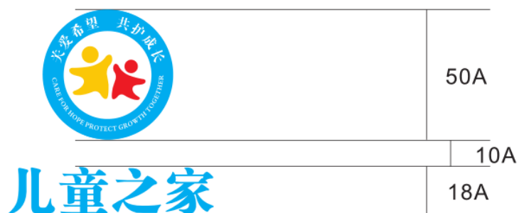
图 A.2 儿童之家内室标识标牌